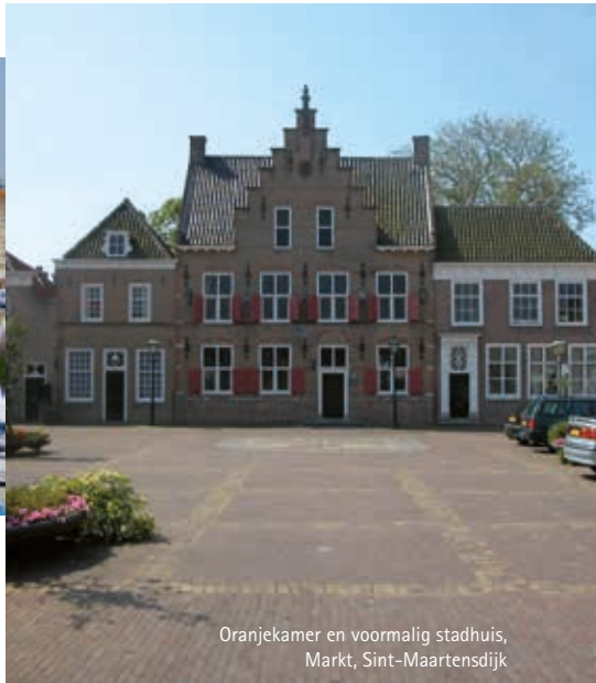
Oranjekamer en voormalig stadhuis, Markt, Sint-Maartensdijk