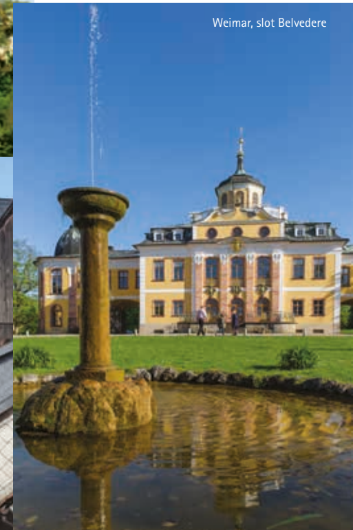
Weimar, slot Belvedere

van de schrijvers te zien zijn, is door haar opgericht. U kunt zowel te voet als met de fiets de sporen van Sophie volgen, de belangrijkste locaties liggen langs de Ilmtal-fietsroute: het Liszt-Haus in het park aan de Ilm en het Stadslot, de residentie en woning van de (groot-)hertogen. Aan de achterkant van dit paleis is het Nederlandse wapen te zien. Slot en park behoren tot