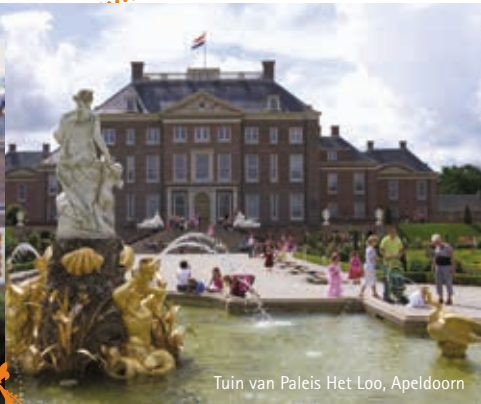
Tuin van Paleis Het Loo, Apeldoorn