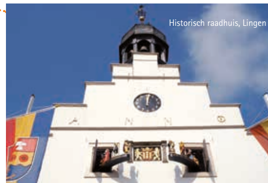
Historisch raadhuis, Lingen