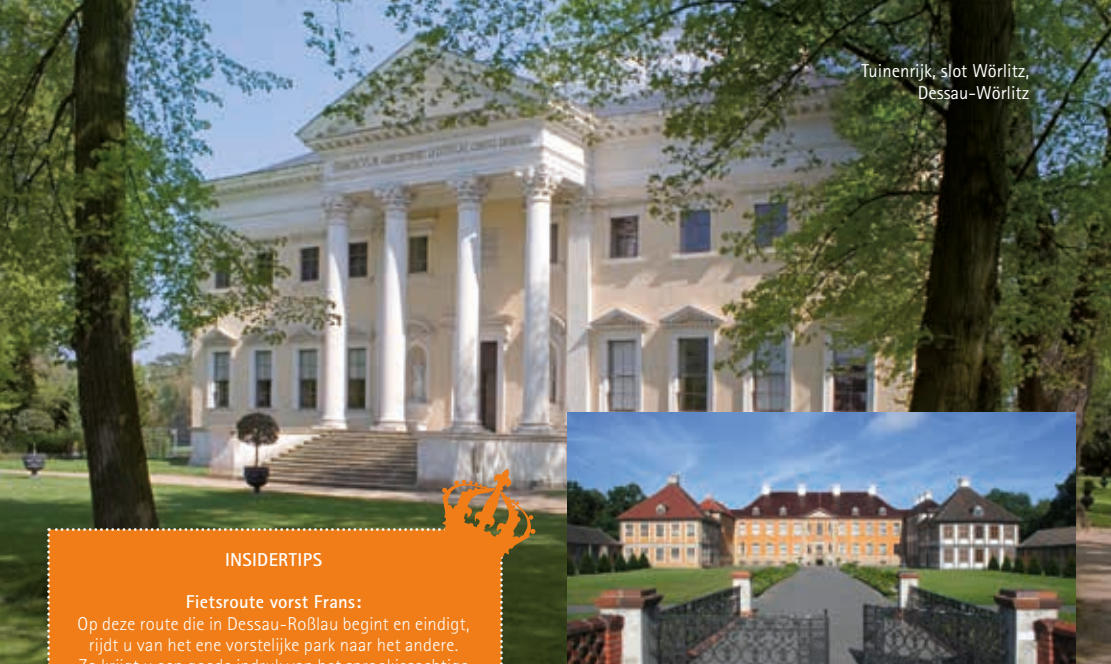
Tuinenrijk, slot Wörlitz, Dessau-Wörlitz