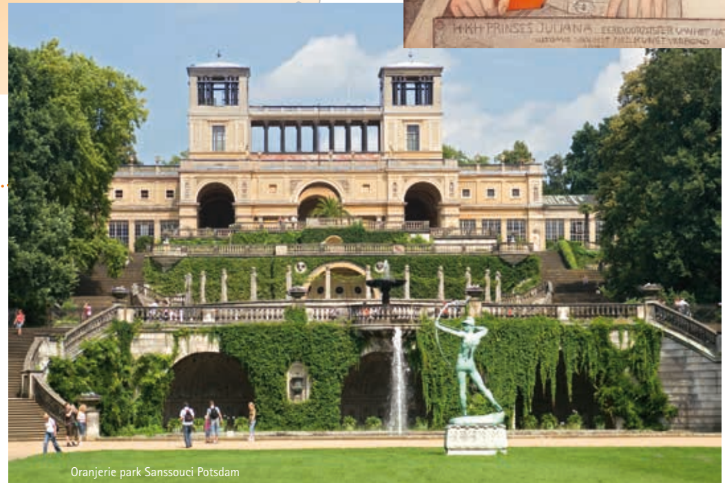
Oranjerie park Sanssouci Potsdam