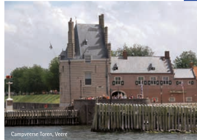
Campveerse Toren, Veere