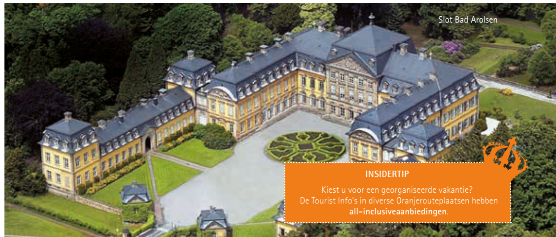
Slot Bad Arolsen

Prinses Emma van Waldeck-Pyrmont, de latere koningin der Nederlanden, is in het slot van Bad Arolsen geboren en getogen. Haar huwelijk met koning Willem III en de geboorte van dochter Wilhelmina behoedden de dynastie van Oranje-Nassau voor uitsterven. Nakomelingen van het vorstenhuis Waldeck-Pyrmont wonen nog steeds in het slot, dat opengesteld is voor het publiek. Het museum Bad Arolsen, de barokke Schlossstraße en muziekkuitvoeringen brengen het verleden tot leven. Andere interessante musea in Bad Arolsen zijn het streekmuseum, het museum voor voorjaars- en paastraditie en het speelgoedmuseum. Ook de historische drinkwaterinstallatie is een bezoek waard.