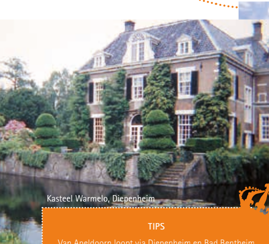
Kasteel Warmelo, Diepenheim