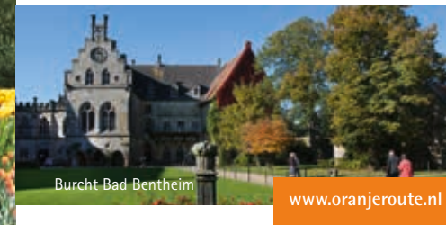
Burch Bad Bentheim

Een bezoek van koningin Emma aan Bad Bentheim was voor de bewoners en gasten van dit kuuroord een bijzondere beleving. Nu is het Bentheimer Bad een modern wellnesscentrum. In de minerale baden die met 4 wellnesssterren zijn onderscheiden, kunt u heerlijk ontspannen. Zelfs in de winter is het water in het buitenbad 32 °C. Het Bentheimer Wald leent zich voor heerlijke wandelingen. Daarnaast trekken de vele fietspaden in het Grafschaft Bentheim vakantiegangers aan.