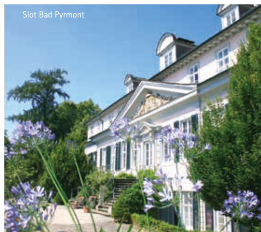
Slot Bad Pyrmont

In de Hufeland Therme kunt u zich lekker laten verwennen. U kunt in de omgeving van Bad Pyrmont ook golfen, tennissen, fietsen en nordic walken. Maak een tocht op een stoomboot op de rivier de Weser en bekijk de vele kastelen en burchten langs de beroemde Duitse sprookjesroute!