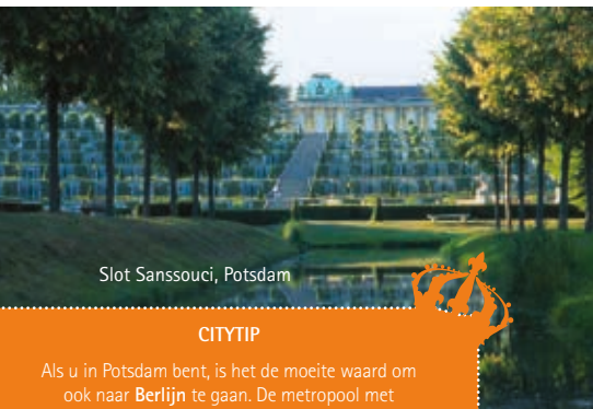
Slot Sanssouci, Potsdam