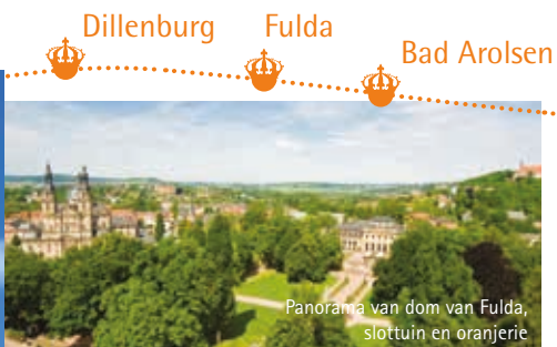
Panorama van dom van Fulda, slottuin en oranjerie

Tussen de barokke dom en het oude centrum pronkt sinds 2014 een steen met bronzen portret van Willem Frederik van Oranje-Nassau. De latere koning van Nederland trok in 1802 naar Fulda en maakte deze stad tot