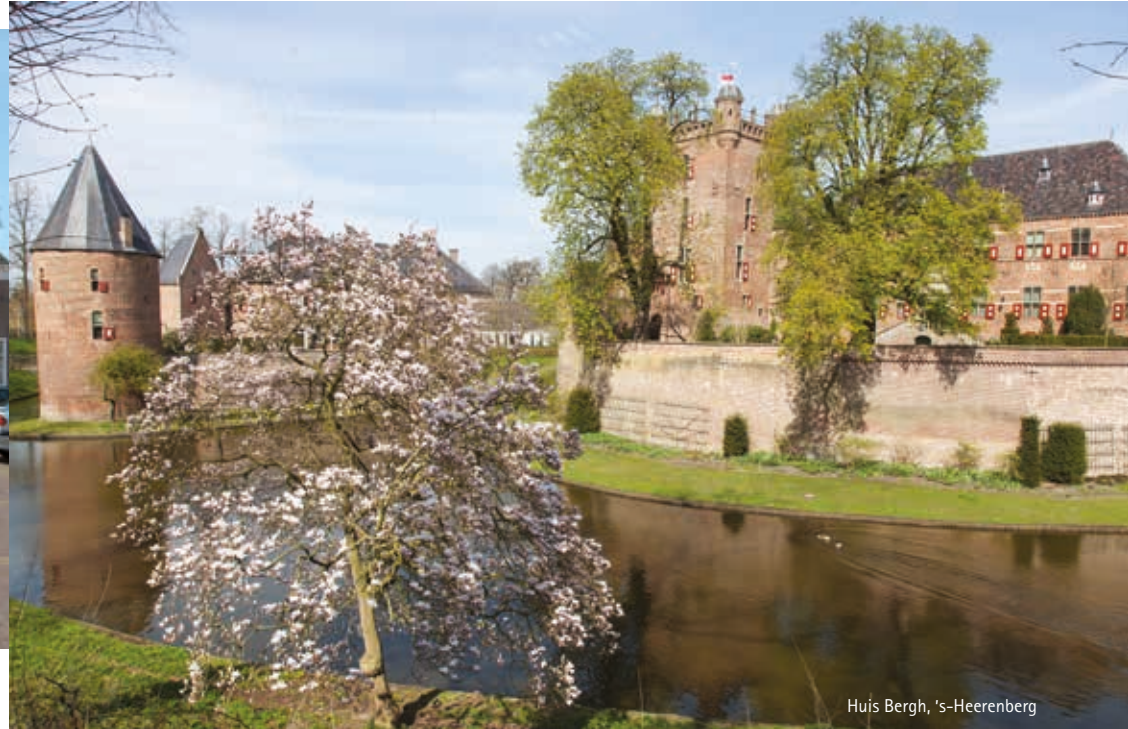
Huis Bergh, 's-Heerenberg