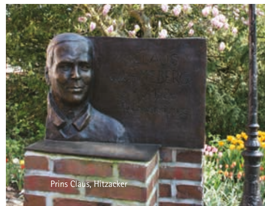
Prins Claus, Hitzacker

In de buurt van Hitzacker lopen vele fiets-, wandel-, nordic-walking- en ruiterspaden, en dit alles tegen het prachtige decor van het biosfeerreservaat Niedersächsisches Elbtalau.