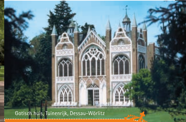
Gotisch huis, Tuinenrijk, Dessau-Wörlitz