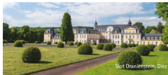
Slot Oranienstein, Diez

In diverse Oranjerouteplaatsen kunt u deelnemen aan een rondleiding door het slot of de stad. Meer informatie is verkrijgbaar bij de plaatselijke Tourist Info.