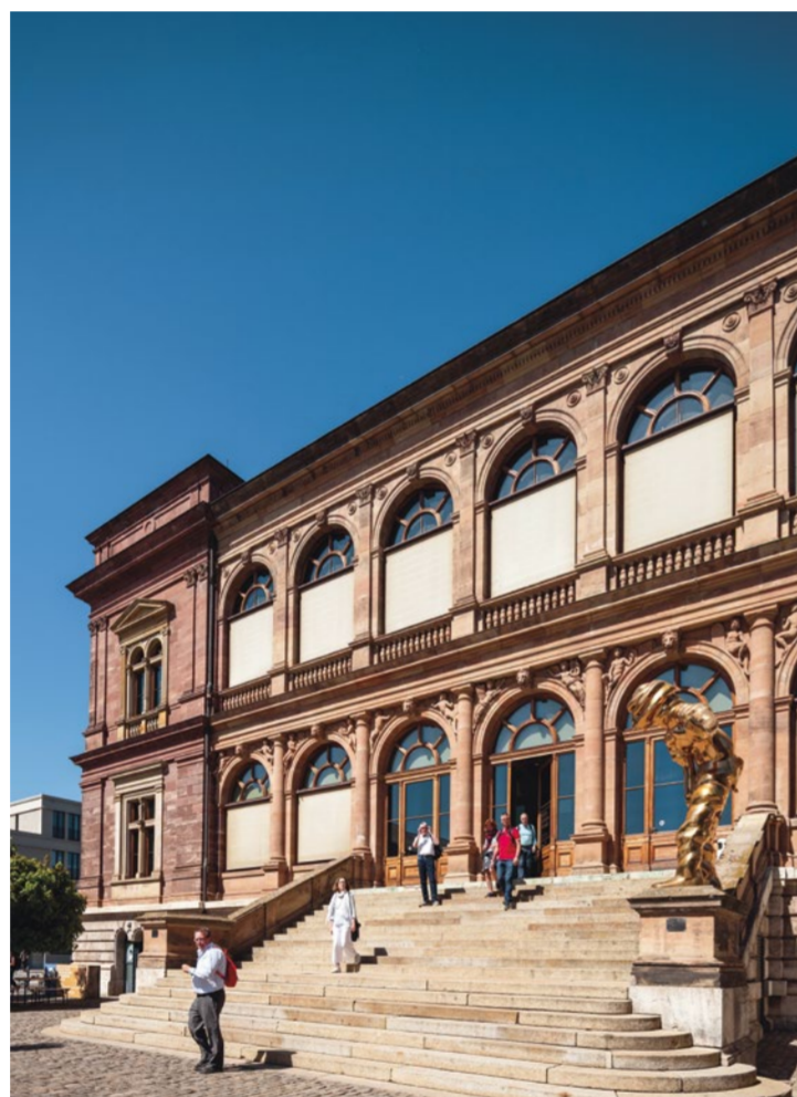
MUZEUM NEUES WEIMAR