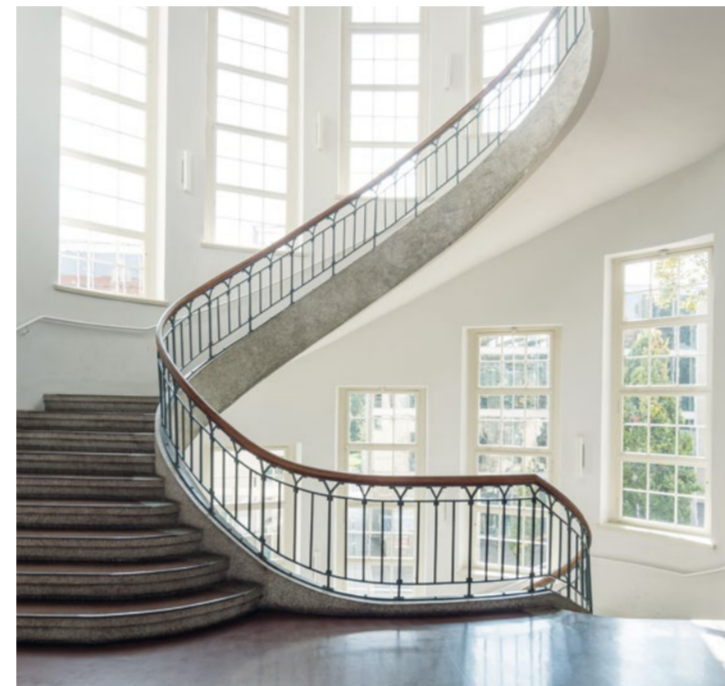
BAUHAUS UNIVERSITA WEIMAR

Zajímá vás, jak vypadá slavná univerzita a co se učí dnešní studenti designu, architektury, nebo nových médií? Vydejte se s nimi na komentovanou prohlídku univerzitním komplexem a uvidíte místa, kde učil Walter Gropius, Johannes Itten nebo László Moholy-Nagy. Studenti vás zavedou do řemeslných dílen, uměleckých ateliérů i do kanceláře bývalého ředitele Gropia. Podrobnější informace o termínech prohlídky najdete na stránkách univerzity: www.uni-weimar.de