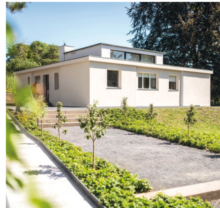
HAUS AM HORN

Dokonalou ukázkou toho, jak má vypadat moderní bydlení, uvidíte v rodinné rezidenci Haus am Horn, kterou navrhovali pedagogové a studenti Bauhausu. Co bylo středobodem domácnosti, proč je dětský pokoj největší a jaké technické vymoženosti patří do moderní kuchyně? To vše představili autoři návrhu v roce 1923, kdy se ve Výmáru konala výstava Bauhaus Werk-schau. Dům je poblíž parku Am Ilm a jeho výjimečnost ocenila odborná komise, která ho zapsala na seznam památek UNESCO. Na stejném seznamu je také slavná brněnská vila Tugendhat, kterou navrhl Mies van der Rohe, jenž vedl Bauhaus po nuceném přesídlení do Desavy a Berlína.