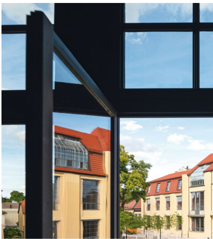
BAUHAUS UNIVERSITA WEIMAR