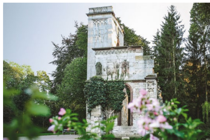
Belvederer Allee 58 Okres zimowy: śr. – pon. w godz. 10.00 – 16.00 od ostatniej niedzieli października Okres letni: śr. – pon. w godz. 10.00 – 18.00 od ostatniej niedzieli marca

Dom mieszkalny zaprojektował belgijski architekt i doradca artystyczny Wielkiego Księcia, Henry van de Velde, dla swojej siedmioosobowej rodziny. Dziś jest on przykładem syntezy sztuk, łącząc architekturę, ogrodnictwo i aranżację wnętrz.