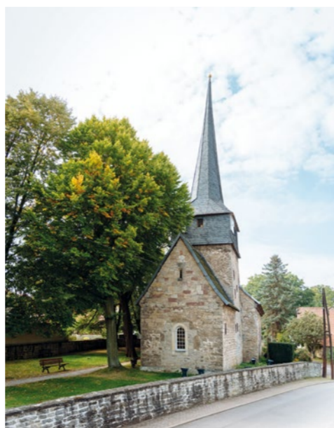
KOŚCIÓŁ FEININGERA W GELMERODZIE

Start: Budynek główny Bauhaus-Universität w Weimarze, ul. Geschwister-Scholl-Straße 8