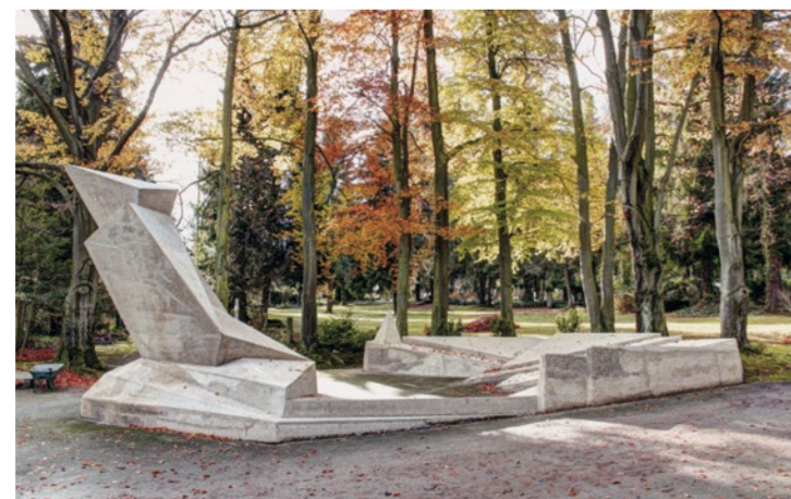
Karl-Liebknecht-Straße 5 Wt. – niedz. w godz. 10.00 – 17.00

W Muzeum Miejskim można zwiędzić wystawę stałą pt. „Demokracja z Weimaru. Zgromadzenie Narodowe w 1919 roku”. Atmosferę okresu założenia Republiki Weimarskiej przywołują zabytkowe przedmioty, filmy, plakaty i wiele innych eksponatów z tamtych lat.