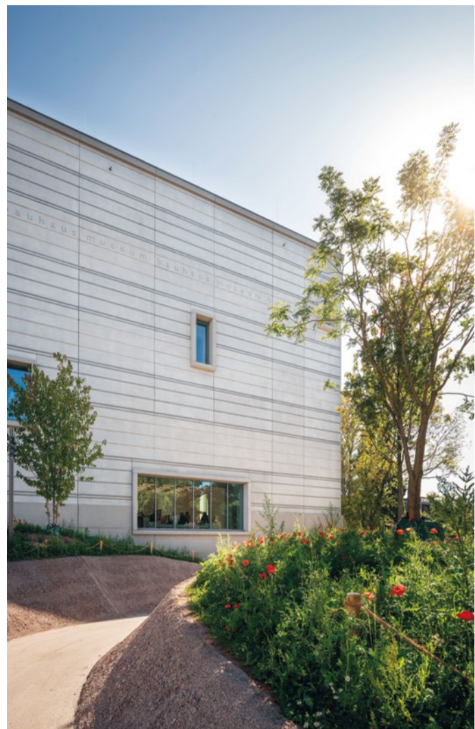
MUZEUM BAUHAUSU W WEIMARZE

Począwszy od pierwszych kroków modernizmu weimarskiego przez założenie Bauhausu aż po polityczne zawirowania początku XX wieku, wywołane powstaniem i upadkiem Republiki Weimarskiej – w mieście tym możemy prześledzić wszystkie etapy tamtej epoki. W tym celu najlepiej odwiedzić Nowe Muzeum, Muzeum Bauhausu czy Dom Republiki Weimarskiej. Na tym jednak nie koniec – przedstawiamy również szereg innych miejsc, które warto odkryć.