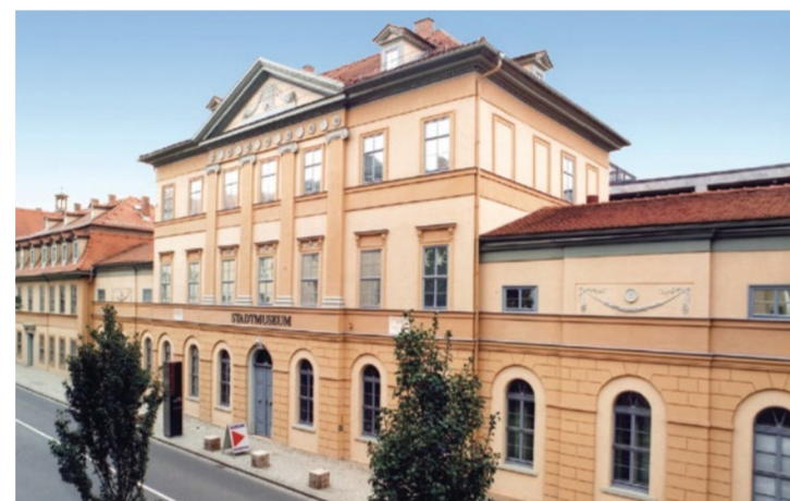
Humboldtstraße 36 Okres zimowy: śr. – pon. w godz. 10.00 – 16.00 Okres letni: śr. – pon. w godz. 10.00 – 18.00

W willi Silberblick spędził ostatnie lata swego życia Friedrich Nietzsche. Po jego śmierci siostra filozofa założyła tu poświęcone mu archiwum, zlecając urządzenie wnętrza Henry'emu van de Velde. W willi można również zwiędzić regularnie uaktualnianą wystawę pt. „Bój o Nietzschego”.