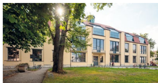
HOOFDGEBOUW VAN DE BAUHAUS UNIVERSITEIT

april tot oktober: woe, vrij en za 14 uur | november tot maart: vrij en za 14 uur Kleine tour duur 1,5 uur | grote tour duur 2,5 uur Trefpunt: Bauhaus-Atelier, Geschwister-Scholl-Strasse 6a | Tickets Tourist Informatie Weimar en Bauhaus-Atelier | Op aanvraag ook in Engels te boeken.