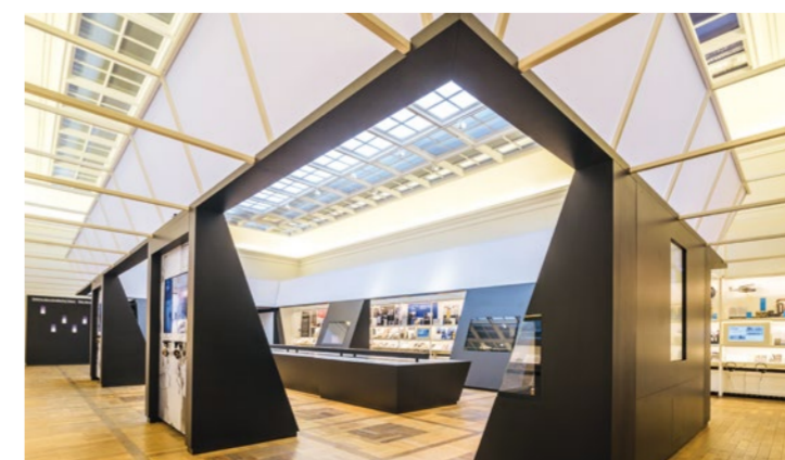
HUIS VAN DE WEIMAR REPUBLIEK