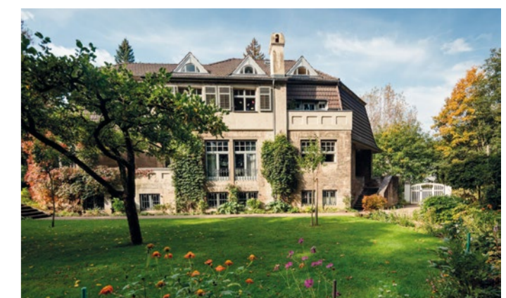
HAUS HOHE PAPPEL VAN HENRY VAN DE VELDE