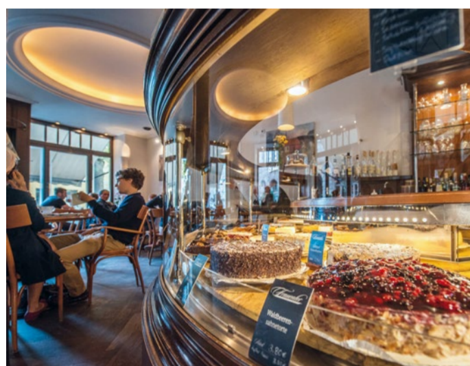
TAARTENSELECTIE IN CAFÉ FRAUENTOR