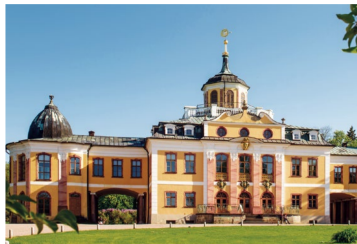
SLOT BELVEDERE. ZOMERRESIDENTIE VAN SOPHIE VAN ORANJE