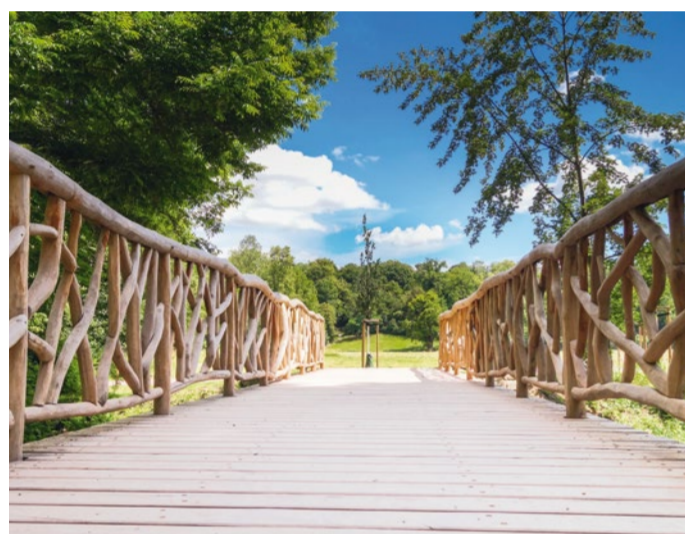
NATUURLIJKE BRUG IN HET PARK OP DE ILM

Park aan de Ilm biedt de bezoeker meerdere prachtige doorkijkjes, schilderachtige beken en grenst direct aan de historische binnenstad steegjes. Lopend, met de bus of fietsend is ten zuiden het barokke zomerverblijf Belvedere bereikbaar. Het indrukwekkende park bevat een orangerie (wintertuin) en een doolhof. Verder stroomafwaarts langs lieflijke weiden, en majestueuze bomen vind je slotpark Tiefurt.