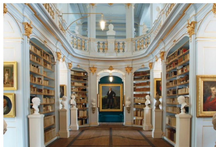
HERTOGIN ANNA AMALIA BIBLIOTHEEK