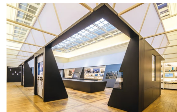
HAUS DER WEIMARER REPUBLIK