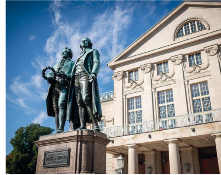
GOETHE-SCHILLER-DENKMAL VOR DEM DEUTSCHEN NATIONALTHEATER WEIMAR

Zahlreiche Höhepunkte setzen Akzente im Weimarer Sommer: Theater auf großen und kleinen Bühnen, Konzerte in Festsälen und als Open Air, leichte Muse und kreative Szene. In Weimar tritt auf, was Rang und Namen hat oder jung und talentiert ist.