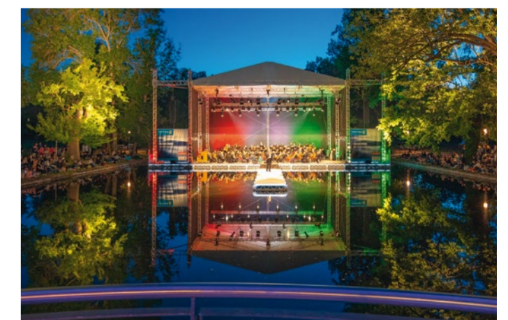
KONZERTNACHT IM WEIMARHALLENPARK