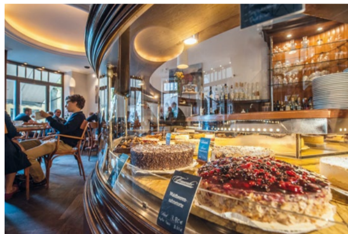
KUCHENAUSWAHL IM CAFÉ FRAUENTOR