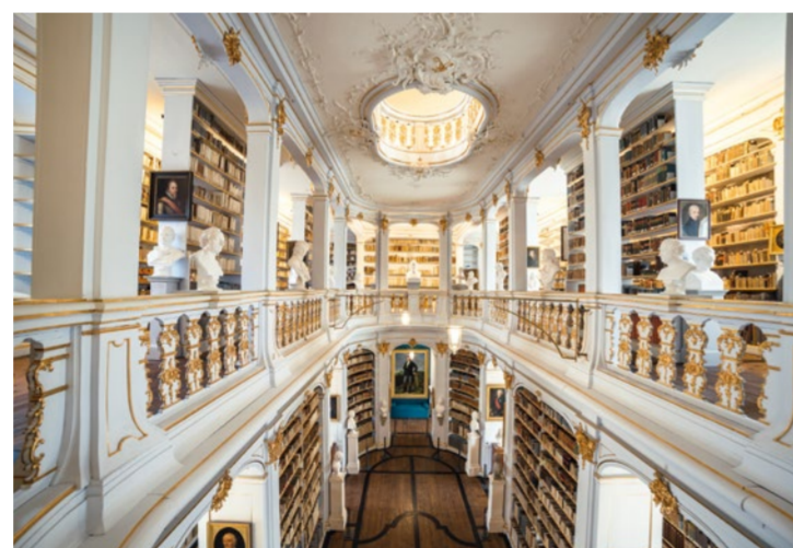
HERZOGIN ANNA AMALIA BIBLIOTHEK, ROKOKOSAAL