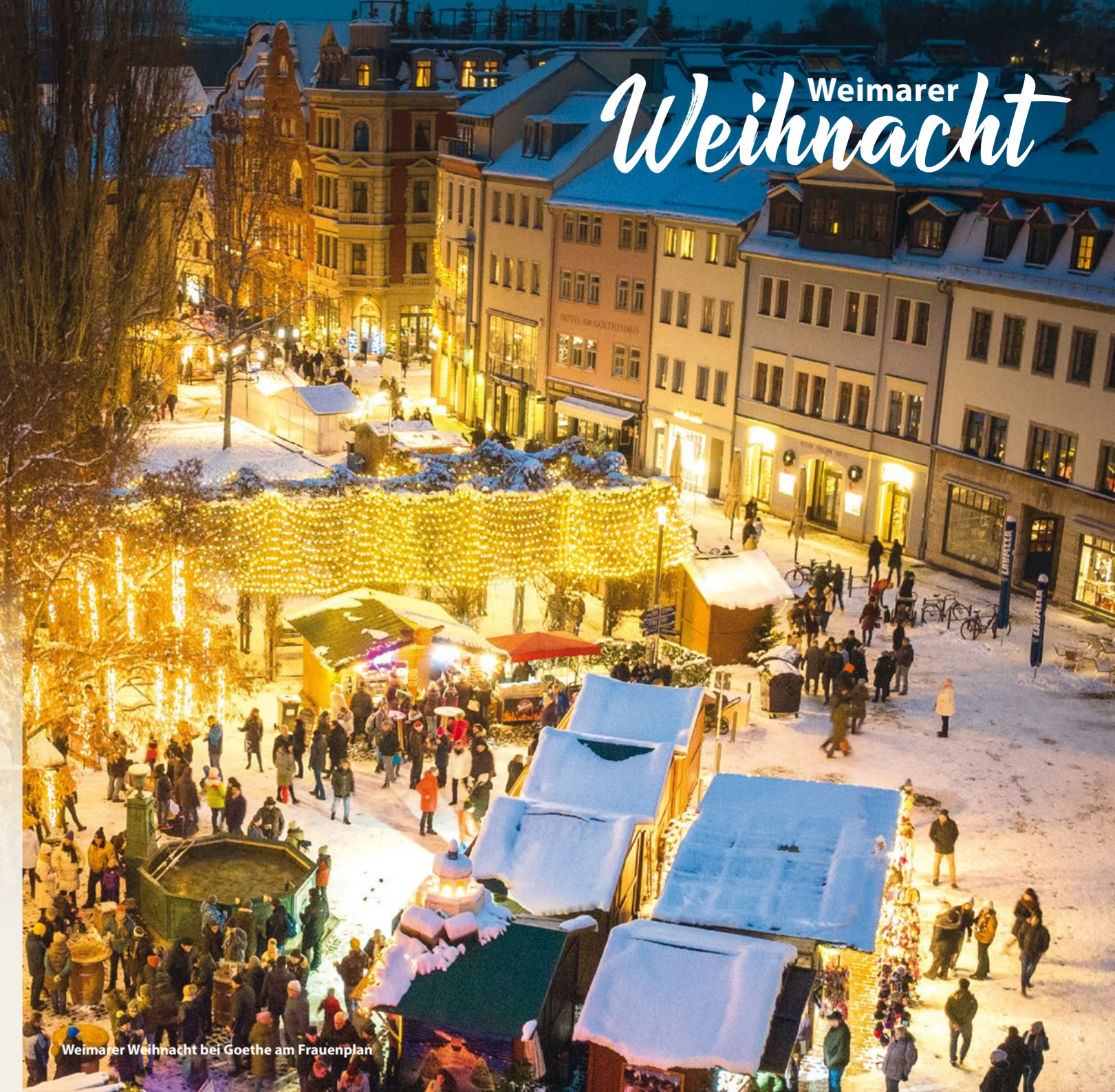
Weimarer Weihnacht bei Goethe am Frauenplan